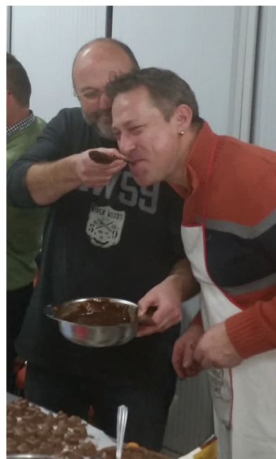
Sfeerbeeld workshop pralines maken

Op 17 december leiden alle wegen naar de 15de kinderkerkmis. We verwachten opnieuw meer dan 100 opgewonden kinderen voor een namiddag spelplezier. Meer info vind je verder in deze Kleine Raak. Deze kinderkerkmis komt er echter niet vanzelf. Reeds vanaf woensdag 14 december om 19u starten we met het opzetten van de Kinderkerkmis. Hiervoor rekenen we op zoveel mogelijk helpende handen. KWB leden die de handen uit de mouwen wensen te steken en de spelletjes samen met ons willen opstellen zijn van harte welkom.